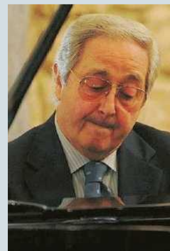
Il compositore Stelvio Cipriani

● Concerto-evento domani alle ore 17:30 e ad ingresso libero, presso l'Associazione degli Umbri in via Ulisse Aldrovandi 16 a Roma, in occasione della pubblicazione dell'autobiografia di Stelvio Cipriani "Anonimo Romano". Il compositore della colonna sonora del film "Anonimo Veneziano" eseguirà al pianoforte alcune delle sue musiche più celebri. Interverranno Massimo Palombi e Rosario Montesanti.